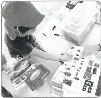
▲まだ字が読めなくても、保育者のサポートによって図鑑で調べます。

「なんでだろう?」「どうしてだろう?」そんな子どものつぶやきを日々、聞いているのではないのでしょうか。さまざまな体験を重ねて育っている子どもの好奇心・探究心について、専門職としてどのように受けとめ、かわっていくのか、あらためて考えてみませんか。