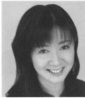
音楽 大島 ミチル(作曲家)