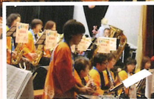
アンサンブル太陽