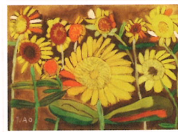
藤澤奈央 「ひまわり2003 世界に1つだけの花」