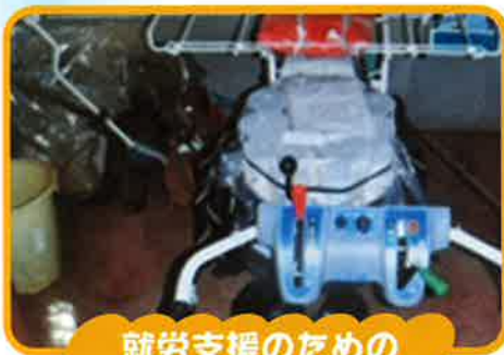
就労支援のための 野菜半自動移植機の購入