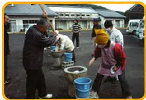
餅のお届け・ひとり暮らし ふれあい交流会

その他の募金の使いみちは、 ホームページの 「ありがとうメッセージ」 をご覧ください。