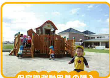
保育園運動用具の購入

この募金収入は、県内の民間福祉施設や福祉団体等の活動の支援に使われますので、今年もとりわけ福祉関係の皆様の変わらぬご理解とご協力をお願いいたします。