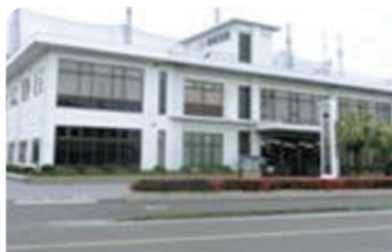
※自販機前面には企業名等を記載自販機イメージ図

鶴崎海陸運輸(株)では、従来から共同募金運動にご協力いただいていたが、今回、新たな地域貢献活動として、赤い羽根自販機を設置されました。担当の方は「これまでも企業として募金をしていましたが、この自販機は、飲料を買うだけで、購入者一人一人が募金できます。身近な地域への社会貢献活動の一つとして、当社は協力していきたい。」と話していただきました。