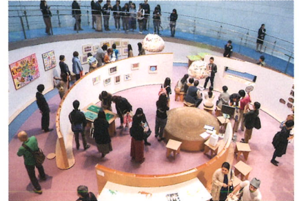
2017年度 日本財団 DIVERSITY IN THE ARTS 企画展 ミュージアム・オブ・トゥギャザー 会場風景

多様な個性に寛容な社会の実現を目指し、美術館の整備・展覧会開催・人材育成・情報発信など、障がい福祉の現場で育まれてきたアート活動への支援をおこなう。