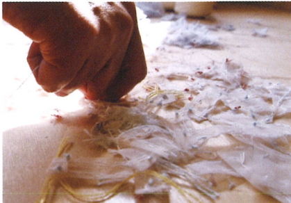
※11/3 [±] 17:00～ 関連映画の上映有り

鹿児島市にある福祉施設。「与えられる」から「創り出す」へ。ものづくりを通じた福祉の新たな可能性を見出すために、利用者とスタッフがともに表現者として創作に関わる。